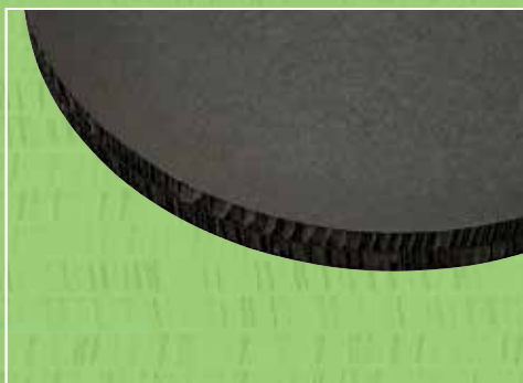
Svart genomfärgad kartongbas.