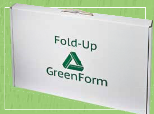
Alla Fold-Ups levereras i en praktisk transportlåda.